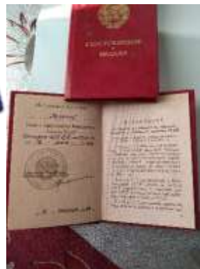
Рис. 4,5, 6

Из приказа № 027/Н от 18 мая 1944 года по 371 Стрелковому полку 180-й Таганрогской Краснознамённой ордена Суворова дивизии «... наградить стрелка 3